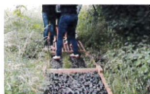
Parcours PIEDS NUS : accès libre

Accueil de groupes, centre de loisirs/aérés, IME, asso ... en journée Juillet ( complet ) et Aout sur réservation (activités nature, rando bocage avec guide)