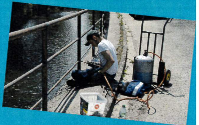
Peinture des garde-corps de la rivière