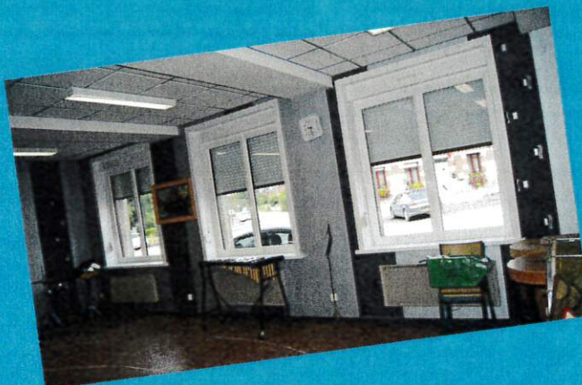
Remplacement des fenêtres de la salle de musique