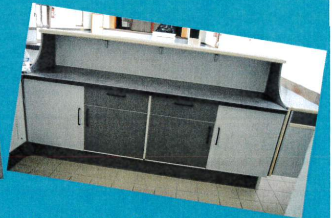
Rénovation du bar de la salle des fêtes