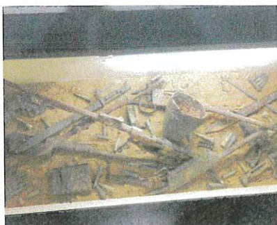
Armes retrouvées au Fort