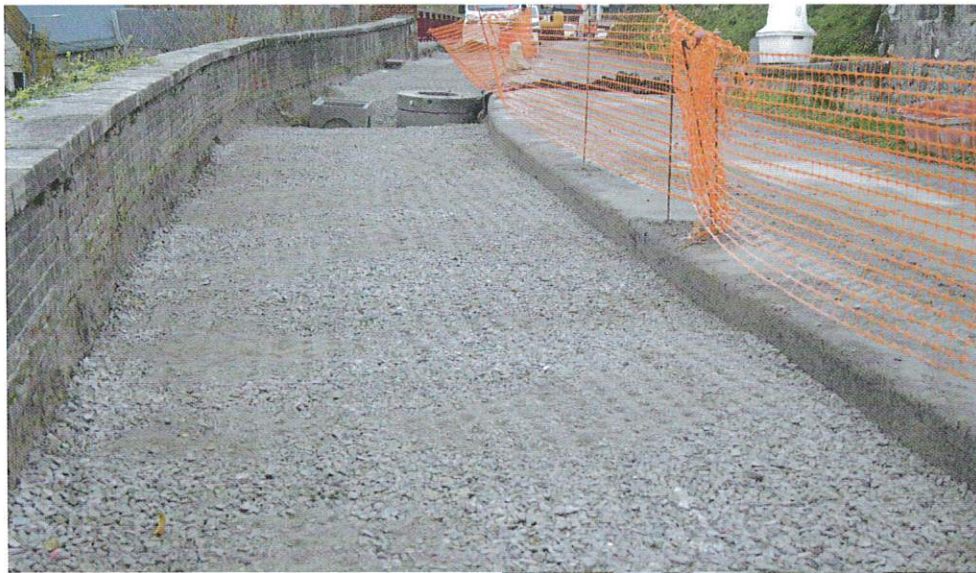
Sol recompacté et regards de visite réseaux séparés (eaux usées et eaux pluviales)