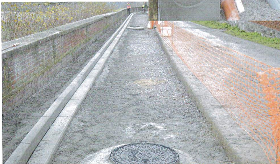
Bordures du trottoir + tampons regards et eaux pluviales