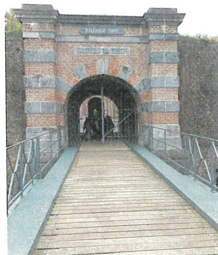
Entrée du Fort avec son pont levis