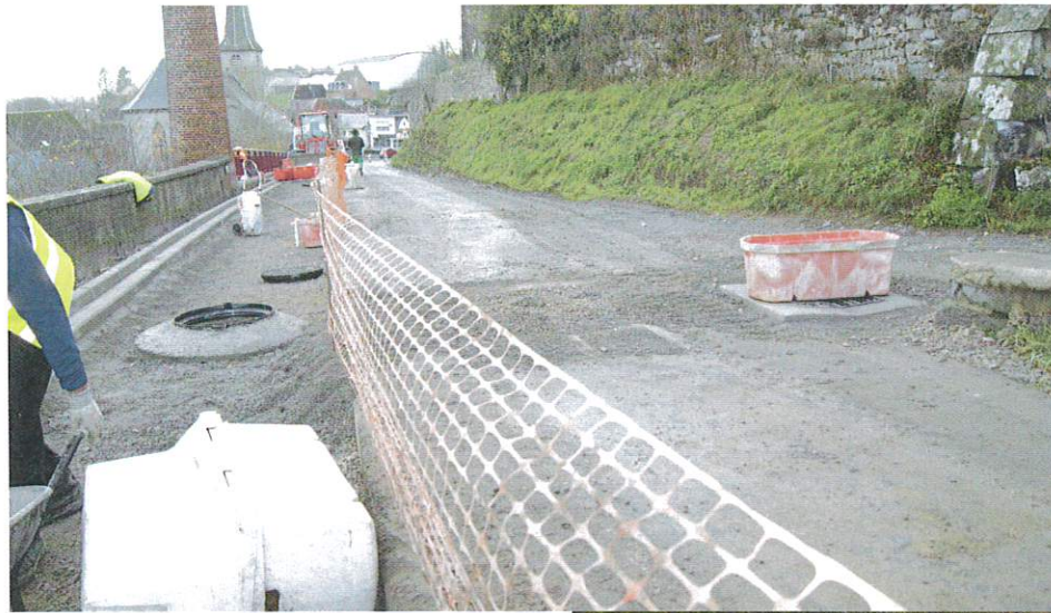
Grille à droite récupération eaux pluviales