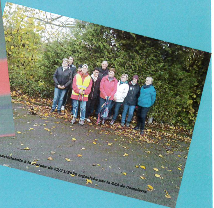
Les participants à la marche du 22/11/2022 organisée par la GEA de Dompierre