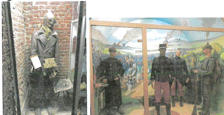
Soldats Allemands faits prisonniers par les Français

Nous avons observé en détail les uniformes des soldats français. Le premier étant trop voyant avec le pantalon rouge, ils en ont reçu un nouveau qui permettait de mieux se camoufler. Dans une vitrine, nous avons également vu un uniforme d'aviateur.