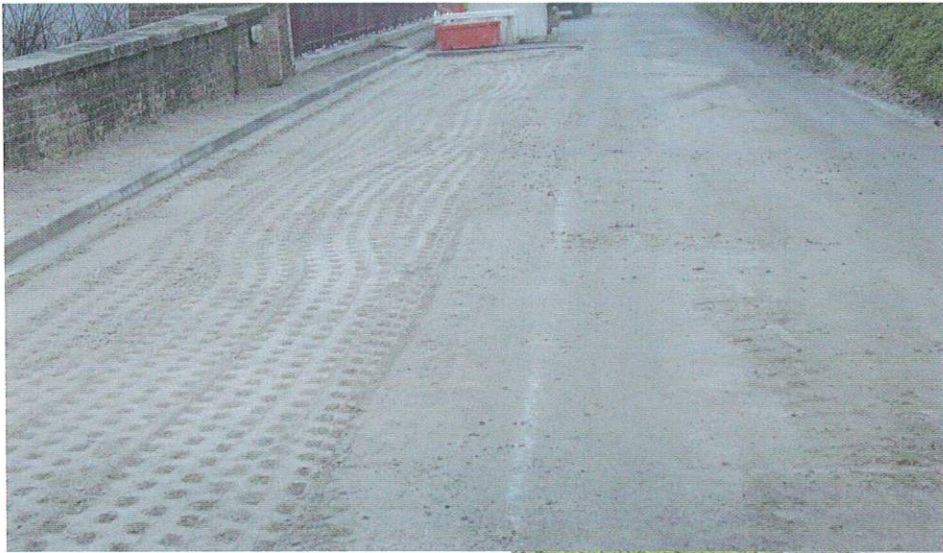
Préparation avant enrobés