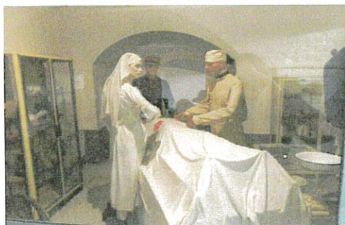
Reconstitution de l'infirmerie avec le médecin, l'infirmière et le prêtre