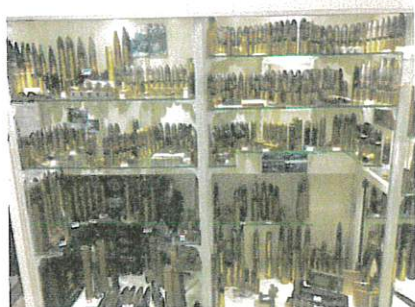
Une vitrine avec des munitions

Nous avons vu des armes comme des fusils, des obus, des munitions et un canon reconstitué à l'entrée du Fort.