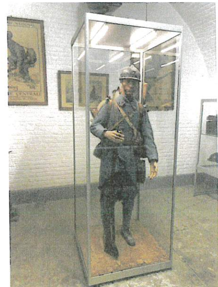
Le soldat français et son barda