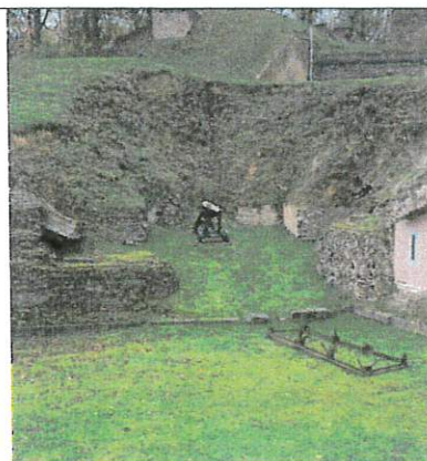
Reconstitution d'un canon