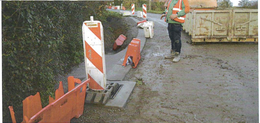
Avaloir fossé bas cour école