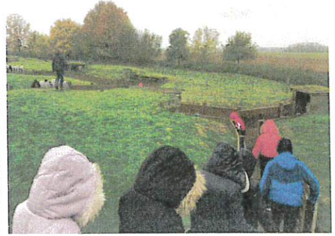
Visite de la tranchée extérieure

Nous avons traversé une tranchée reconstituée à l'intérieur et nous avons entendu les bruits sur les champs de bataille. Le guide nous a emmenés voir une tranchée reconstituée à l'extérieur. C'était très intéressant car comme il pleuvait nous avons pu imaginer les conditions très difficiles des soldats pendant cette guerre.