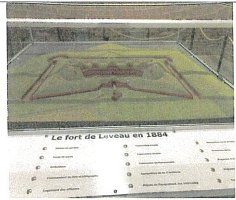
La maquette du Fort