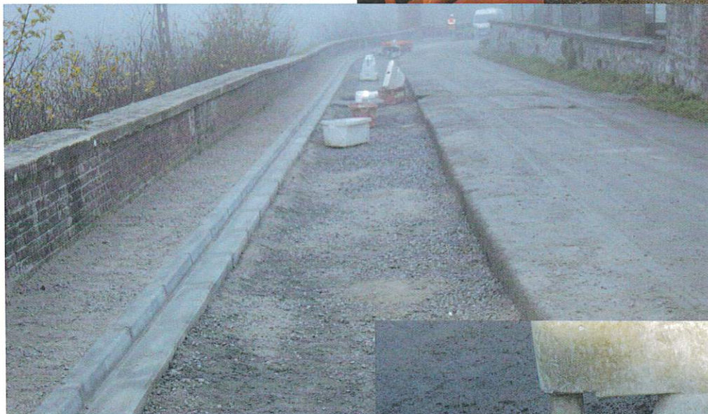
Nouveau tampon récupération ancien réseau Compactage trottoirs avant enrobés