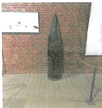
Un obus de 900 kg